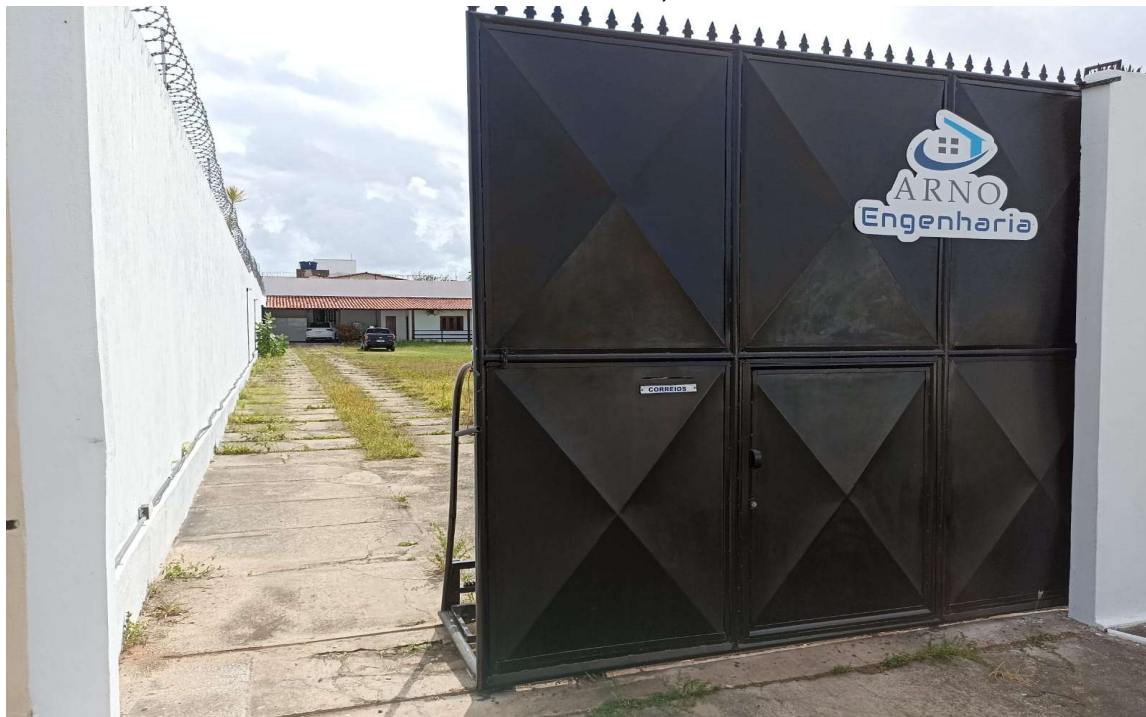
FACHADA EXTERNA – 3 -2.486002, -44.224560